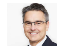
→ RA Georg Wohl www.staiger.law