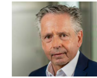
→ RA Rolf Rombach www.rombach-rechtsanwaelte.de