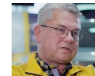
→ Claus Trilling www.opel-nossmann-rheinbach.de