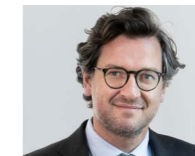
→ RA Stefan Weileder www.grafisola.at