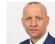
→ Philipp Meiser www.salzgitter-flachstahl.de