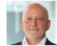
→ Markus Mühlenbruch www.ebnerstolz.de