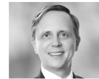
→ RA Dr. Biner Bähr www.whitecase.com