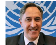
→ RA Erol Arduç www.unhcr.org/dach/de