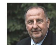
→ RA Paul Wuntschek www.wuntschek.com